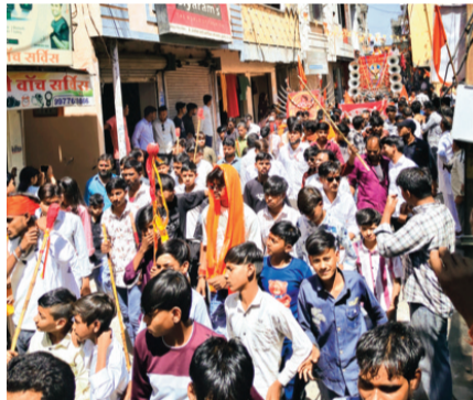
खुजनेर। श्रीराम नवमी के पावन अवसर पर शुक्रवार को फूलमाली समाज द्वारा हर वर्ष की तरह इस वर्ष भी प्रभु भगवान श्रीराम का जन्मोत्सव धूमधाम और श्रद्धा के साथ मनाया। इस अवसर पर शहर में भव्य चल समारोह निकाला गया, जिससे पूरे नगर को भक्तिमय माहौल में रंग दिया। समारोह में भगवान श्रीराम की आकर्षक और भव्य झांकी प्रमुख आकर्षण का केंद्र रही। साथ ही बजरंग अखाड़ा के कलाकारों और छोटी बालिकाओं ने

हैरतअंगेज अखाड़ा करतब प्रस्तुत कर सभी का मन मोह लिया। श्रद्धालुजन श्रीराम के भजनों और गीतों पर झूमते-गाते हुए पूरे मार्ग में शामिल रहे। चल समारोह माताजी मोहल्ले से प्रारंभ होकर राजगढ़ चौराहा, शिवाजी बाजार, झंदा पीपल, मस्जिद चैक, पुराना थाना, इमली बाजार और जीरापुर रोड होते हुए खेड़ापति हनुमान मंदिर पहुंचा। जहां महाआरती कर महाप्रसादी वितरण की गई। इस बीच नगर में चल समारोह का पुष्पवर्षा कर भव्य स्वागत किया गया।