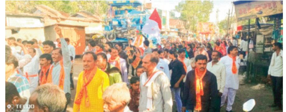
हरिभूमि न्यूज़ ▶ गावलपुर

नगर के मालाकार फूलमाली समाज द्वारा रामनवमी का पर्व बड़े ही धूमधाम से मनाया गया। सभी समाजजन नगर के सामाजिक हिंगलाल माता मंदिर पर एकत्रित हुए जहां से शोभायात्रा नगर में निकाली गई। जिसमें एक आकर्षक भगवती राम की चलित झांकी सजाई गई थी। शोभायात्रा नगर के प्रमुख मार्गों से होकर गुजरी जिसमें समाज के युवा वा महिला पुरुष भजनों की घुन पर थिरकते हुए चल रहे थे। यात्रा का नगरवासियों ने