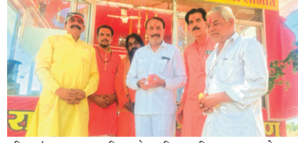
हरिभूमि न्यूज़ ▶ सरंगपुर