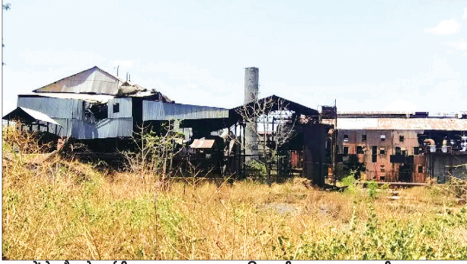
नवाबों के दौर से बर्बादी तक का सफर

जमीन विक्रय की खबरों ने बड़ाई हलचल बता दें पिछले कुछ समय से शहर में यह चर्चा जोरों पर थी कि बंद पड़ी शुगर मिल की बेशक्रीमती जमीनों को बेचने की तैयारी की जा रही है। जैसे ही यह मामला नगर पालिका के संज्ञान में आया, प्रशासन ने अपनी वित्तीय सुरक्षा और शहर के राजस्व को ध्यान में रखते हुए यह बड़ी कार्रवाई की।