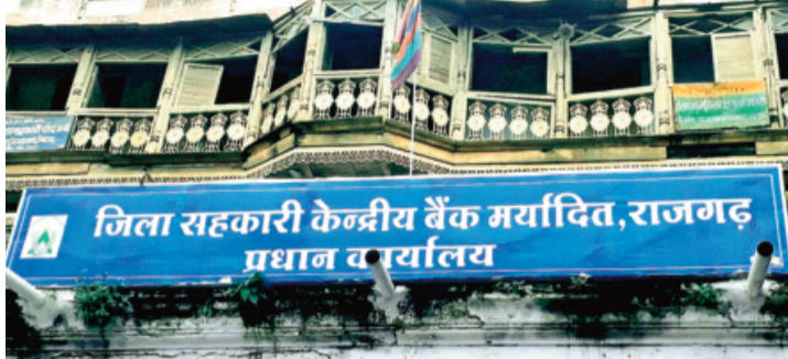
राशि की वसूली की प्रक्रिया को प्रभावी बनाया जा सके।