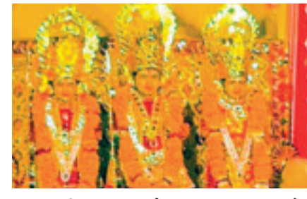
भगवान श्री राम का जन्मोत्सव मनाया गया। प्रत्येक मंदिर में विशेष साज-सज्जा के साथ आरती एवं धार्मिक अनुष्ठान उपरान्त भक्तों को प्रसादी का वितरण करवाया गया।

प्रतिवर्षानुसार इस वर्ष भी नगर के पारायण चौक में श्री राम-जन्मोत्सव विभिन्न धार्मिक आयोजनों के साथ उल्लास के साथ मनाया गया। दोपहर 12 बजते ही सप्ताह मंदिर परिसर श्रीराम के जयकारों से गूंज उठा और भगवान की महाआरती आरंभ हुई। आयोजन में नगर के सैकड़ों श्रद्धालु महिला, पुरुष, बच्चे शामिल हुए और धर्मलभा लिया। राम-जानकी मंदिर की महाआरती में सम्मिलित होने के उपरान्त श्रद्धालुओं ने सामने स्थित राधा-कृष्ण मंदिर एवं गिरांजनी की भी पूजा-अर्चना कर आरती उतारी। इसके उपरान्त मंदिर में आए प्रत्येक जन को विशेष प्रसादी एवं चरणाभूत का वितरण करवाया गया।