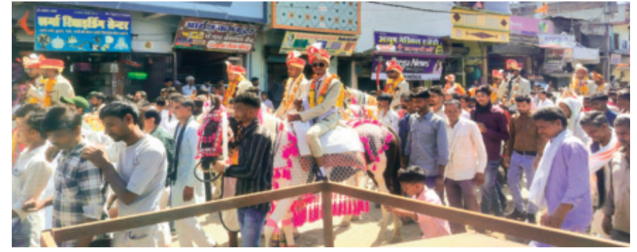
हरिभूमि न्यूज़ ▶ ब्यावरा

शहर के ढकोरा रोड स्थित श्री संकट मोचन वीर हनुमान मंदिर समिति के तत्वावधान में रामनवमी के अवसर पर 21 जोड़ों का निःशुल्क सामूहिक विवाह सम्मेलन आयोजित किया गया। मंदिर समिति ने सेवा और समर्पण की एक अनुपम मिसाल पेश करते हुए शुक्रवार को 21 जोड़ों का सामूहिक विवाह सम्मेलन में विवाह करवाया। पूरी तरह निःशुल्क आयोजित इस सम्मेलन में सर्वधर्म समभाव और सामाजिक समरसता का नजारा देखने को मिला। कार्यक्रम की शुरुआत सुबह सात के बस स्टैंड स्थित श्री वैष्णो देवी माता मंदिर से हुई। जहां से दूल्हों 21 को घोड़ों पर सवार कर